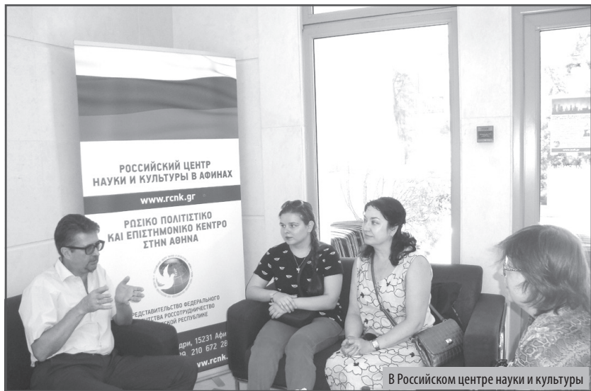
В Российском центре науки и культуры

С 3 по 14 сентября 2018 г. в Афинах побывала группа членов Приморского краевого отделения Всероссийской общественной организации «Русское географическое общество» – Общества изучения Амурского края (далее – ПКО РГО – ОИАК), которое является старейшей на Дальнем Востоке России научно-просветительской общественной организацией.